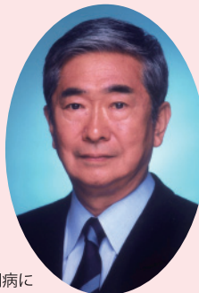
戸塚ヨットスクールを支援する会 会長 石原 慎太郎